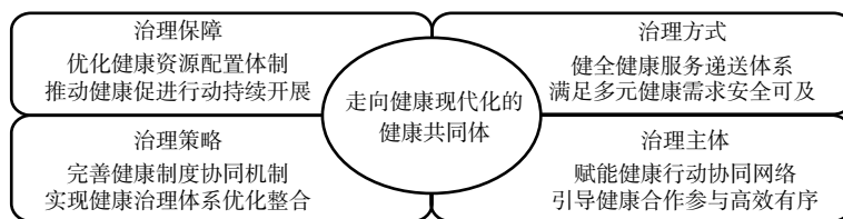
图2 健康共同体的实现路径

健康现代化已经成为推进“健康中国”战略、实现健康“善治”的重要目标和价值归宿,健康共同体作为人类满足共同健康需求的具体组织形式,成为健康现代化的必由之路。健康不仅是一种身体状态,也是一种重要的治理能力,健康治理是国家治理现代化的重要一环。在健康现代化的韧性治理目标下,健康共同体的构建需要立足于全生命周期提升人民健康福祉的根本宗旨,在明晰公共健康脆弱性发生机理与干预机制的前提下,从治理保障、治理方式、治理策略和治理主体四个维度分别提出优化健康资源配置、健全健康服务递送体系、提高健康制度相容、赋能健康协作行动的实现路径(见图2)。渐进实现资源互通、结构优化、服务融合和效能提升,构建富有韧性的公共健康治理生态,最终保障“健康红利”的可持续生产。