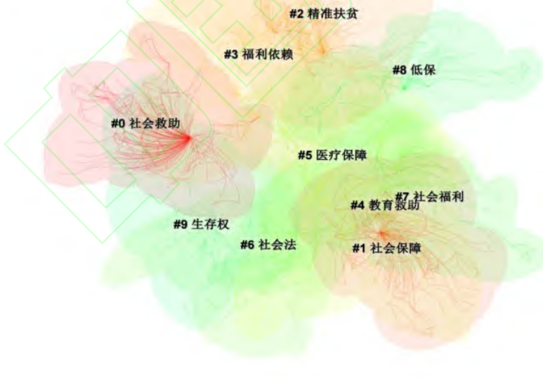
图 1 2010—2021 年社会救助研究关键词聚类图

CiteSpace, v. 5.1.R6 (64-bit) Advanced August 28, 2023 at 6:10:06 PM CST WoS: D:\shizX\data Timespan: 2010-2021 (Slice Length=1) Selection Criteria: Top 50 per slice, LRF=3.0, LN=10, LB=5, e=1.0 Network: N=2083, E=4084 (Density=0.0019) Largest CC: 1637 (78%) Nodes Labeled: 137% Pruning: Pathfinder Modularity Q=0.7525 Weighted Mean Silhouette S=0.9109 Harmonic Mean(Q, S)=0.8322