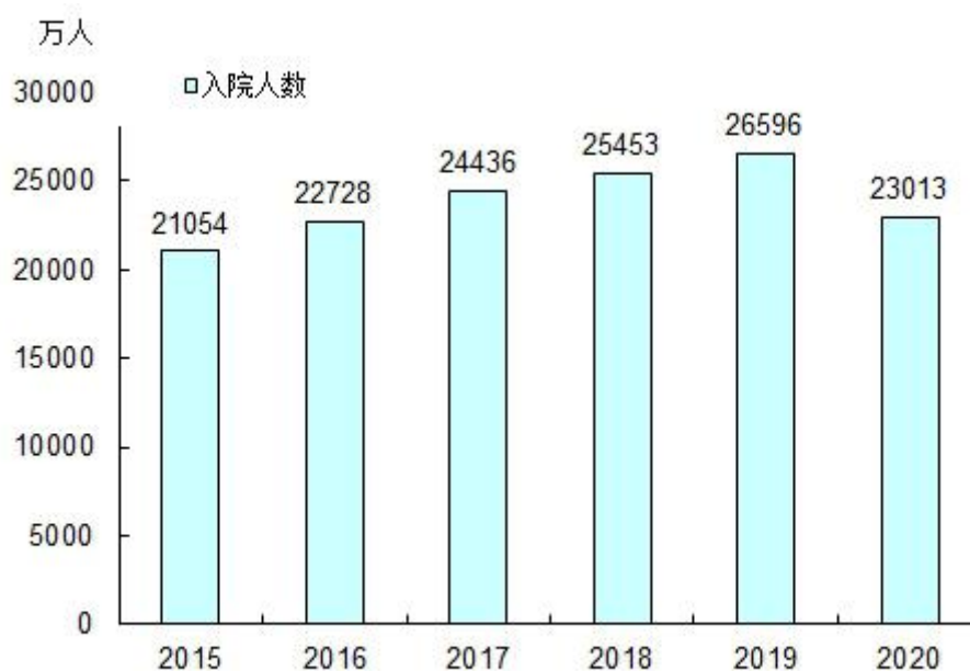
图5 全国医疗卫生机构住院量及增长速度

2020 年，公立医院入院人数 14835 万人（占医院总数的 80.8%），民营医院 3517 万人（占医院总数的 19.2%）（见表 5）。