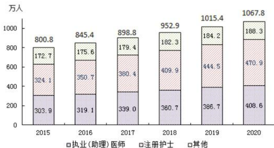
图3 全国卫生技术人员数

2020 年，每千人口执业（助理）医师 2.90 人，每千人口注册护士 3.34 人；每万人口全科医生 2.90 人，每万人口专业公共卫生机构人员 6.56 人。