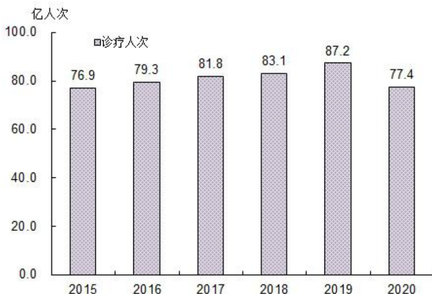
图4 全国医疗卫生机构门诊量及增长速度

2020年乡镇卫生院和社区卫生服务中心(站)门诊量达18.5亿人次,比上年减少1.8亿人次。乡镇卫生院和社区卫生服务中心(站)门诊量占门诊总量的23.9%,所占比重比上年上升0.6个百分点。