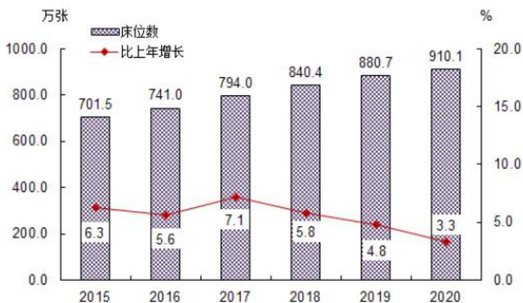
图2 全国医疗卫生机构床位数及增长速度

(二) 床位数。2020年末，全国医疗卫生机构床位910.1万张，其中：医院713.1万张（占78.4%），基层医疗卫生机构164.9万张（占18.1%），专业公共卫生机构29.6万张（占3.3%）。医院中，公立医院床位占71.4%，民营医院床位占28.6%。与上年比较，床位增加29.4万张，其中：医院床位增加26.5万张（公立医院增加11.5万张，民营医院增加15.0万张），基层医疗卫生机构床位增加1.8万张，专业公共卫生机构床位增加1.1万张。每千人口医疗卫生机构床位数由2019年6.30张增加到2020年6.46张。